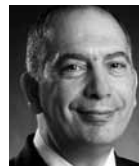
Konzeption und Inhalt: Haris Christodoulatos (Director Special Projects)

Haben Sie Fragen zu dieser Veranstaltung? Wir helfen Ihnen gerne weiter.