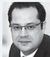
Axel Springer AG Axel Schröder