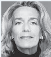
Publizistin, Beraterin für Wirtschaft und Politik, Prof. Dr. Gertrud Höhler